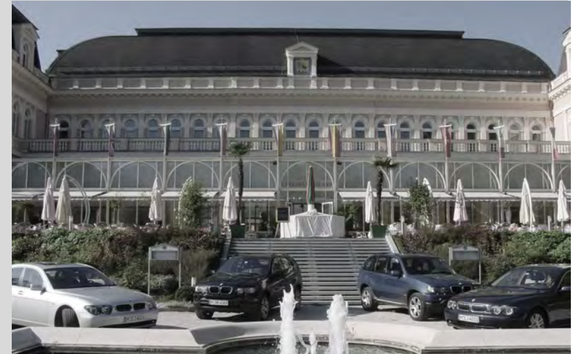
An einem EXTERNEN ORT in einem großen Veranstaltungsraum.