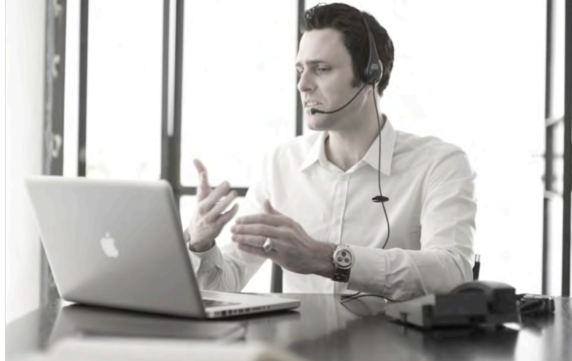
Rufen Sie uns an – wir erzählen Ihnen gerne mehr: 0700 – V I T A M I N T (+49-700-84826468)