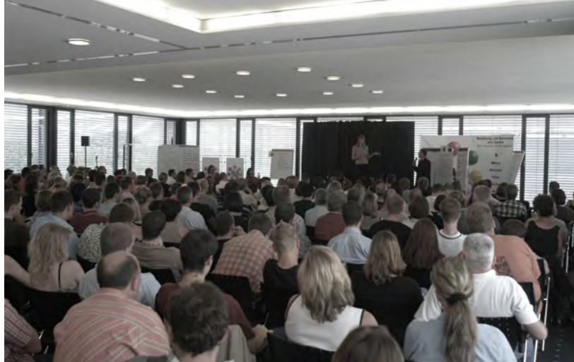
In IHRER ORGANISATION in einem separaten großen Veranstaltungsraum.