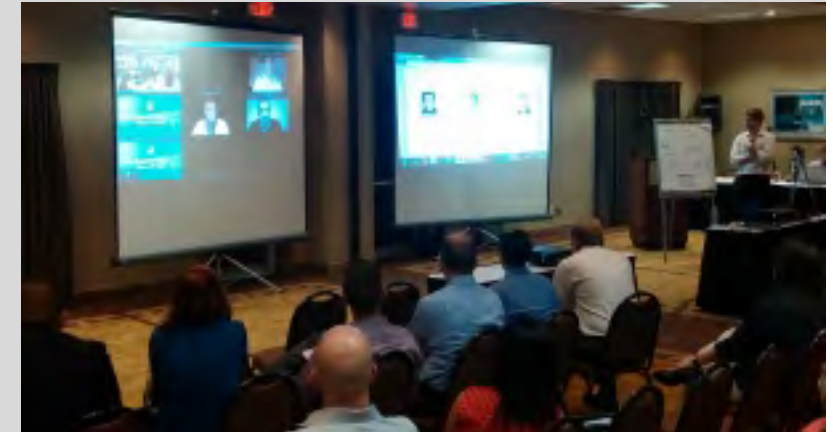
REMOTE über Videokonferenz-Systeme.