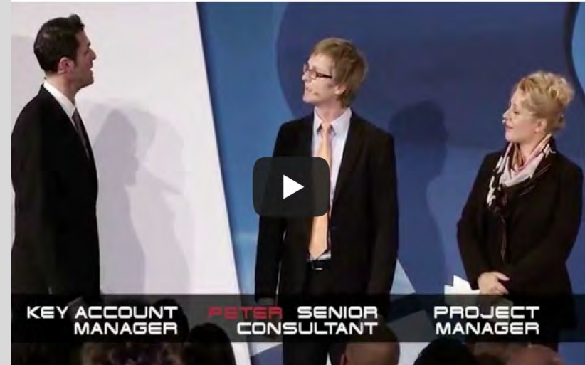
Schauen Sie sich Beispielvideos an auf www.youtube.com/user/VitaminThemen