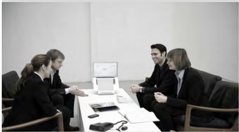
Bestellen Sie eine Live-Demo direkt in Ihrer Organisation zu einem aktuellen Thema.