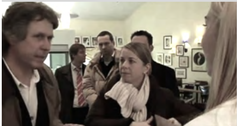
Direkt in der realen Kundenumgebung am POS / TOUCHPOINT (ohne parallelem Kundenverkehr).